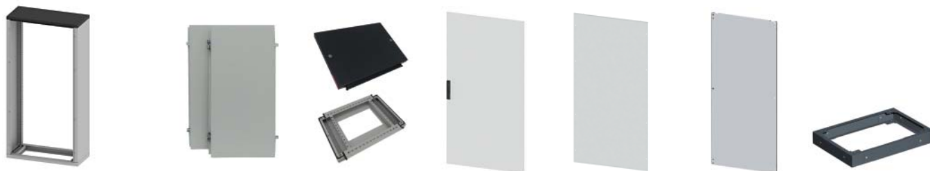
Таблица подбора оборудования